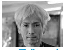
3908 重成 一人 (A1・香川・44歳) 当地はSG覇者5人を相手にGI優勝の実績。