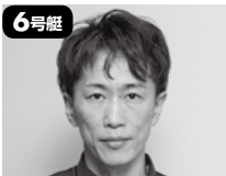
6号艇 4052 興津 藍 (A1・徳島・42歳) 前回2月戦は準優敗れも8走し7度の舟券絡み。