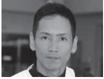
3908 重成 一人 (A1・香川・36歳)

前回は事故もあったが何とか予選はクリア。 ■若松前回成績 15年 1月 一般競走 ②⑤①①④④③④③③