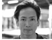
3908 重成 一人 (A1・香川・35歳)

夏場以降は苦戦傾向だが、速攻レースは魅力。 ■若松前回成績 12年 12月 一般競走 ③②②①①③⑥②①①